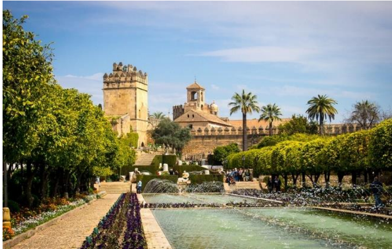
Visite de l'ALCAZAR